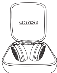
Estuche de transporte rígido con cremallera